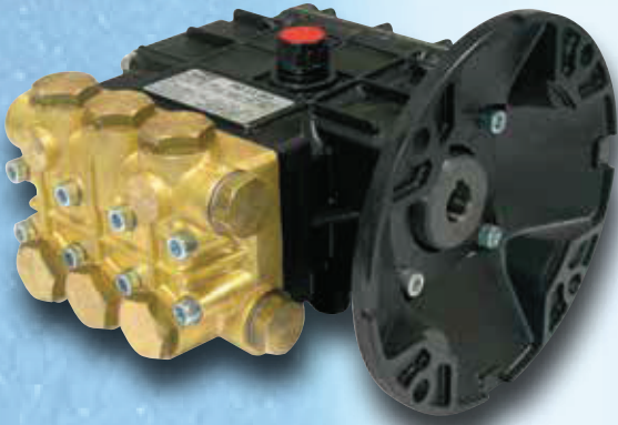
VERSIONE "Z" e "I" "Z" & "I" VERSION